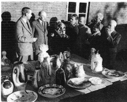
Asger Jorn med sine lerkreationer