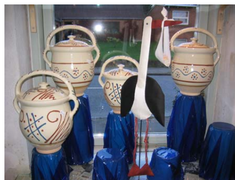
De karakteristiske barselspotter bliver stadig brugt, når storken har været på besøg.